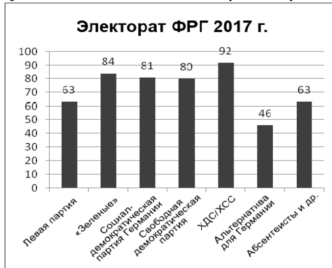
Графики 1-3. Оценка избирателями того, как власть справляется с кризисом COVID-19 в Германии, Франции и Великобритании (% опрошенных, дающих положительную оценку политике)

Абсентеисты и др. – не пришедшие на выборы, не заполнившие или испортившие бюллетень.